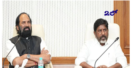
ఎక్కువ సేద్యం చేసే ప్రజలకు ప్రాధాన్యతగా తీసుకోవాలి : డిప్యూటీ సీఎం భట్టి

Published from Hyderabad, circulated to:Hyderabad, Nalgonda, Khammam, Rangareddy, Sangareddy, Warangal, Mbnr, Kurnool, Kadapa, Amaravathi,Krishna