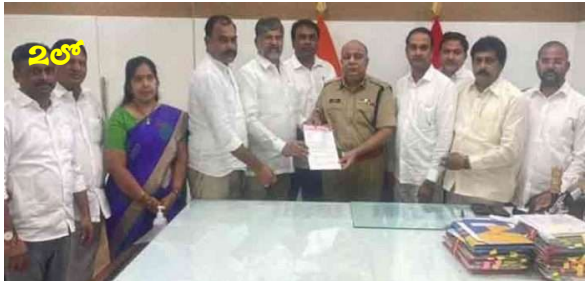
డిజిపి రవి గుప్తాను కలిసిన బిఆర్ఎస్ నేతల బృందం